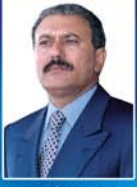
عبدالله بن محمد رئيس الجمهورية

نؤكد على أهمية أن يتحمل القطاع الخاص واجبه الوطني في الدفاع بحركة التنمية والتعاون مع الحكومة في استقرار الأسعار في ظل التوجه لتخفيض الجمارك والضرائب ولما من شأنه تخفيض الأسعار وخدمة المواطنين. . .